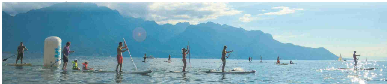
Seul ou en famille. le stand up paddle est à portée de tous.