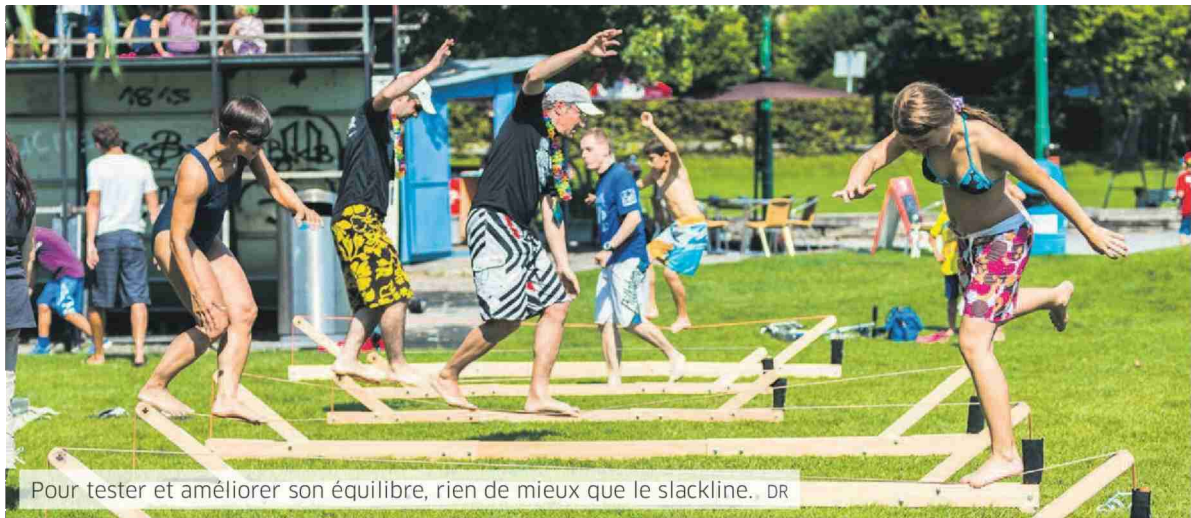
Pour tester et améliorer son équilibre, rien de mieux que le slackline.